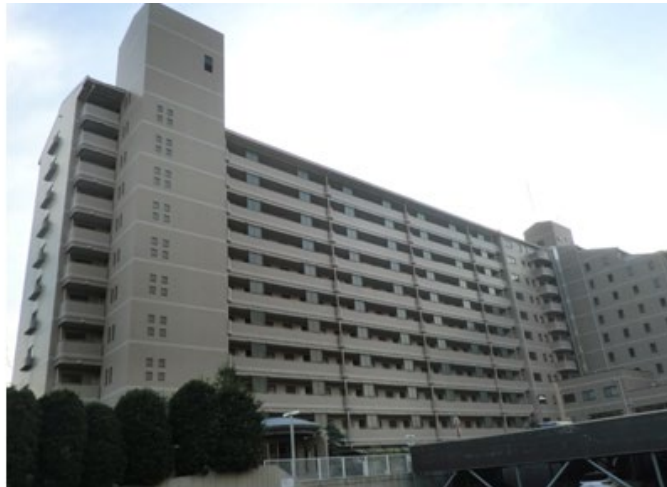
カーシェアリング導入予定の社員寮

日本自動車サービス開発株式会社（本社：東京都千代田区、代表：吉松 裕樹、以下「日本自動車サービス開発」）は、カーシェアリングサービスを、東京地下鉄株式会社（本社：東京都台東区、代表：山村 明義、以下「東京メトロ」）の一部の社員寮において導入する事を発表いたします。本取組は、福利厚生の一環として従業員の利便性向上と環境負荷低減を目的として実施されます。